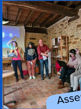
Assemblée générale dans la brasserie